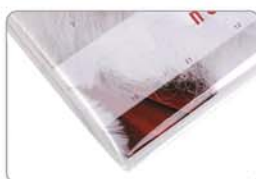
Hygienisch und sauber: Jeder Kalender einzeln in Klarsicht-Verpackung