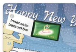
Premium-Schokolade einzeln aromaverpackt