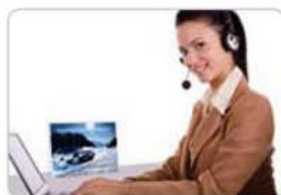
Der Blickfang auf jedem Schreibtisch

Bitte fordern Sie unsere Motiv-Liste per email an info@cartoon-it.de an.