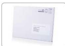
Besonders portofreundlich: Einzelkarton im Großbriefformat