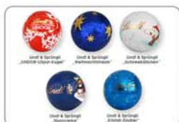
Premium-Schokolade einzeln aromaverpackt