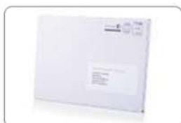
Besonders portofreundlich: Einzelkarton im Großbriefformat