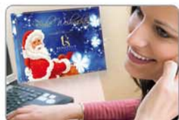
Der Blickfang auf jedem Schreibtisch

alle Preise zzgl. Mwst. und zzgl. Versandkosten Mengenabweichungen von +/- 10% sind aus technischen Gründen vorbehalten.