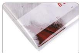
Hygienisch und sauber: Jeder Kalender einzeln in Klarsicht-Verpackung